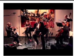
Aloe Blacc est un chanteur soul, rappeur et musicien américain d'origine panaméenne.

« Amadeus » on entend le « lacrimosa » lors de la mort de Mozart.