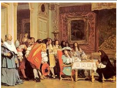
Louis XIV à table

Le Grand Couvert, servi à 22h, était toujours en musique : le Roi soupaît avec la famille royale, en public, face à la tribune des musiciens.