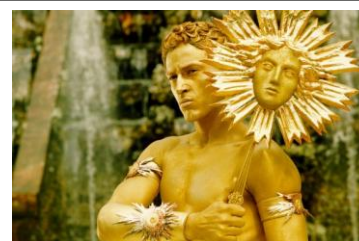
Le personnage du roi soleil dans le film le roi danse.

Durant tout son règne, le Roi-Soleil utilisera la musique et la danse comme un moyen de gouverner.