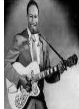
Jimmy Reed (1925 – 1976)

« Mathias James Reed », Jimmy Reed, était un chanteur, guitariste et harmoniciste de blues et rhythm and blues américain, né à Leland, Mississippi, le 6 septembre 1925 et mort à Oakland, Californie, le 29 août 1976.